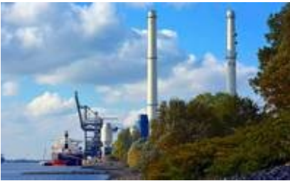
Kohlekraftwerk Wedel

BÜRGERSCHAFT DER FREIEN UND HANSESTADT HAMBURG 21 . Wahlperiode